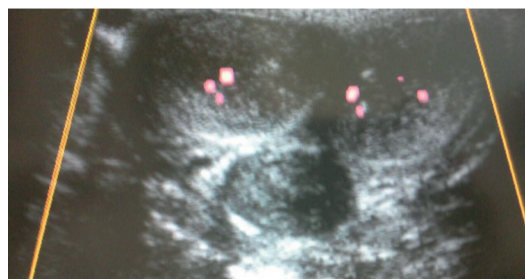
PREVIO AL TRATAMIENTO

SEGUIMIENTO POR ECOGRAFÍA DOPPLER COLOR DEL AUMENTO DE VASCULARIZACIÓN PENEANA MEDIANTE ONDAS DE CHOQUE DE BAJA INTENSIDAD